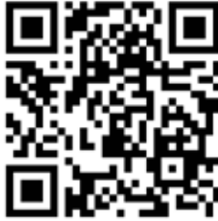
QR-kod som leder till Equmeniakyrkans internationella arbete

Ett exempel är miljövård i byar där Karenfolket bor, i norra