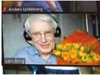
Digital avtackning på årsmötet.

– Gemenskapen med övriga i styrelsen kommer jag att sakna, liksom inblicken i alla delar av församlingens verksamhet. Och ibland även att kunna bokföra lite en kväll, när man inte har något annat att göra. Då är den kvällen räddad, säger han litet självvironiskt, väl