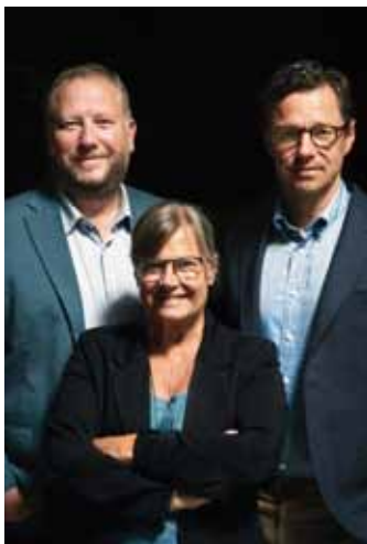
De nya kyrkoledarna.

Ett av flera stora beslut på kyrkokonferensen var val av kyrkoledartrio för