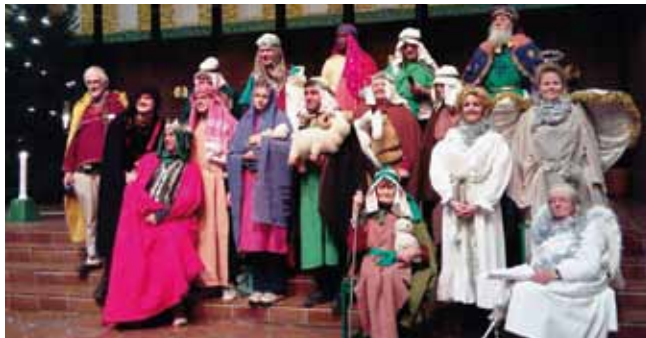
Ny Gemenskaps julspele i Immanuelskyrkan 2018

Ny Gemenskap har sina rötter hos kristna ungdomar som engagerade sig i det nya och alternativa julfirandet i slutet på 1960-talet. Verksamheten fortsatte efter jul som en ideell förening och har i år firat 50-årsjubileum. Ny Gemenskap samarbetar med Stockholms stad, cirka 40 olika församlingar samt andra hjälporganisa-