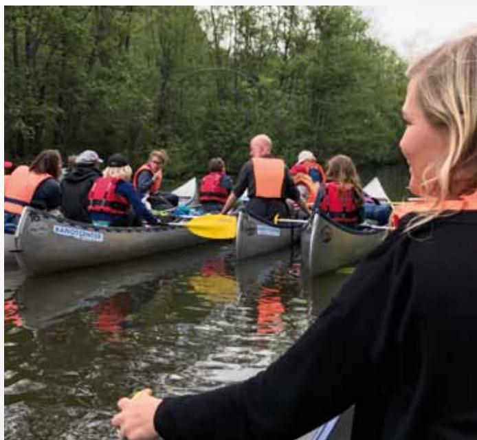
Fikapaus under scouternas utfärd och läger på sjön Båven i Södermanland.