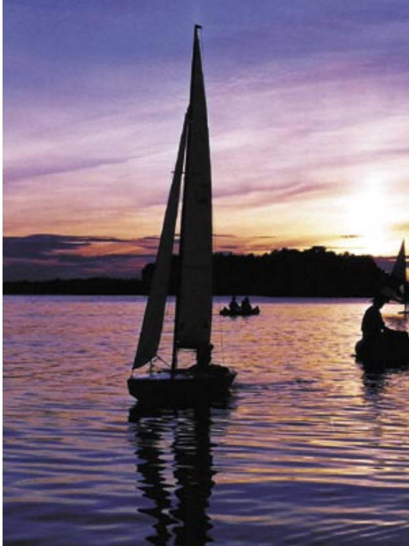
Besökskväll på Koviken under ett seglarläger med HSK Vindens Vänner.