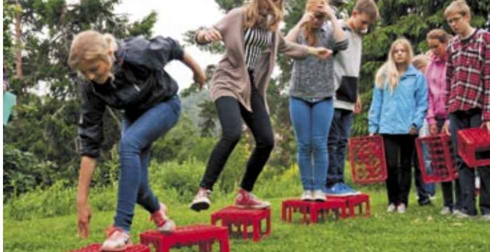
SAMARBETSÖVNING PÅ KONFIRMATIONSLÄGRET PÅ KOVIKEN. SAMTLIGA KONFIRMANDER OCH LEDARE HITTAR DU PÅ SIDAN 12.