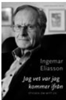
”Jag vet var jag kommer ifrån” utkommer under mars 2013.