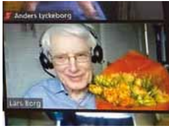
Digital avtackning på årsmötet.

– Gemenskapen med övriga i styrelsen kommer jag att sakna, liksom inblicken i alla delar av församlingens verksamhet. Och ibland även att kunna bokföra lite en kväll, när man inte har något annat att göra. Då är den kvällen räddad, säger han litet självvironiskt, väl